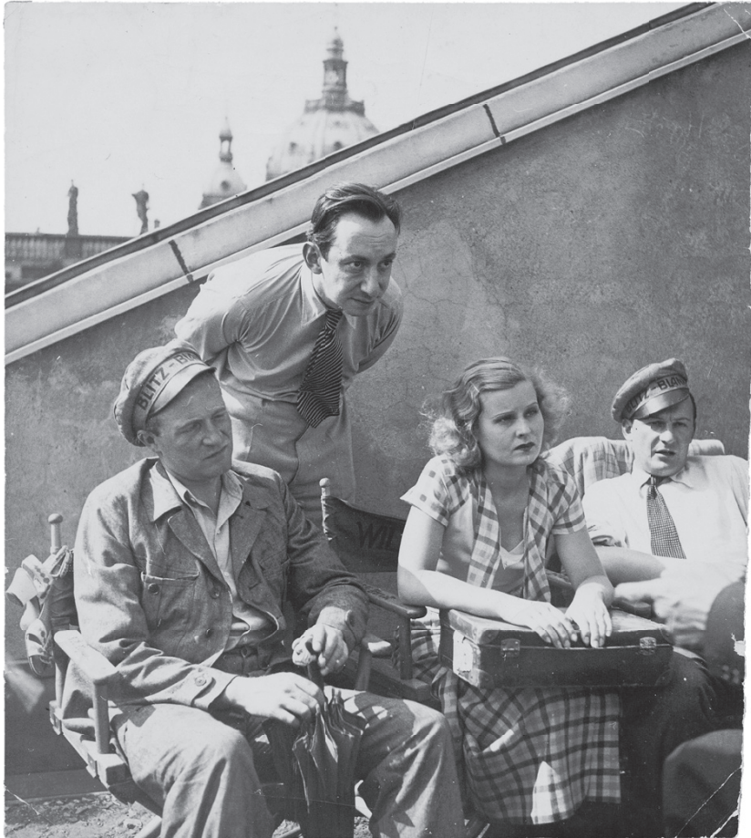
Drehpause der UFA-Stars auf dem Set zum Film «Ein blonder Traum» (1932): Links (sitzend) Willy Fritsch, daneben Lilian Harvey und Willi Forst. Der «romanische» Stammgast Werner Richard Heymann (stehend) schrieb die Musik, der Stammgast Robert Gilbert die Texte dazu, die Stammgäste Billie Wilder und Walter Reisch verfassten das Drehbuch.